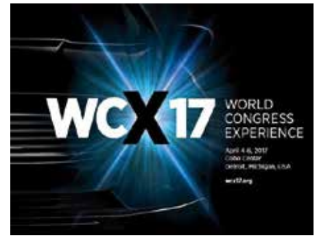
Grafik: Spurgeon, Margo